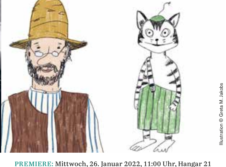
Illustration © Greta M. Jakobs