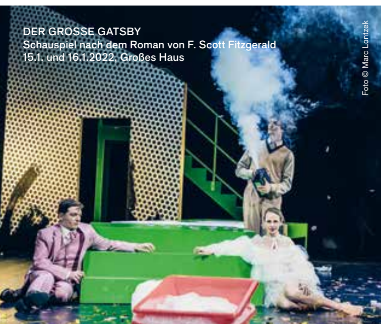
DER GROSSE GATSBY Schauspiel nach dem Roman von F. Scott Fitzgerald 15.1. und 16.1.2022, Großes Haus