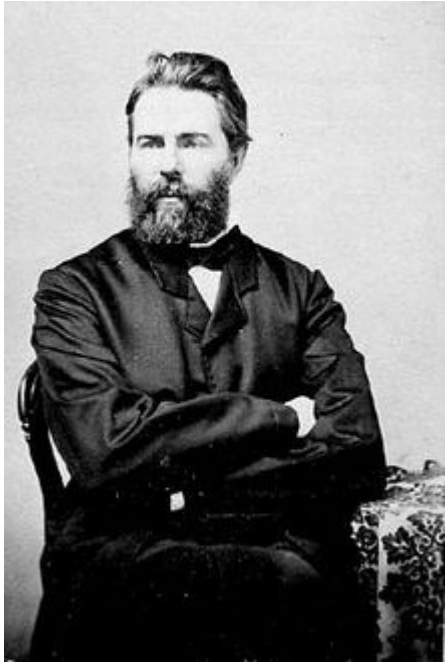
Herman Melville (1860)

Er behandelt die Geschichte des Schiffsjungen Ismael, der, voller Tatendrang und Wissbegier, auf einem Walfänger anheuert. Allerdings muss er schnell feststellen, dass der Kapitän des Schiffs keinen besonderen Wert auf die eigentliche Mission, den Walfang, legt, sondern, von Rachsucht getrieben, sich einzig und allein der Suche nach dem mysteriösen weißen Wal, Moby Dick, verschrieben hat.